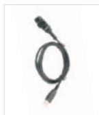
Cable de programación (USB)